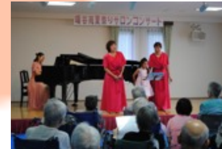
音楽療法士の砥先生：県内外で活躍されています