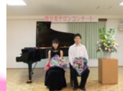
日本の第一線で活躍しているプロの歌声